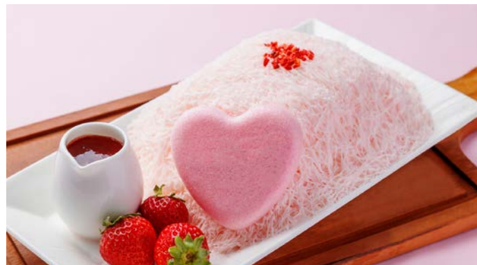
いちご糸ピンス Strawberry Shaved Ice