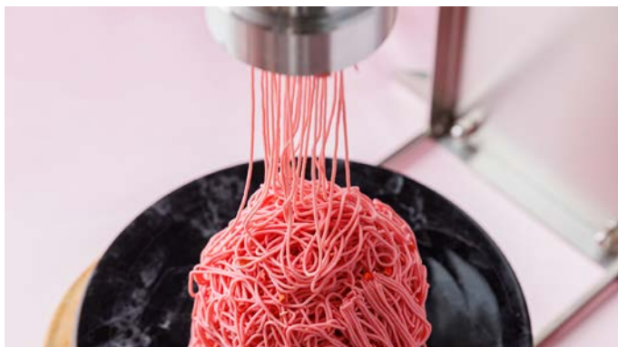
いちごモンブランシャワー Strawberry MontBlant Shower

クリームチーズにいちごを合わせて モンブラン風に仕立てました タルトの中の抹茶アイスクリームと相性バツグン！！