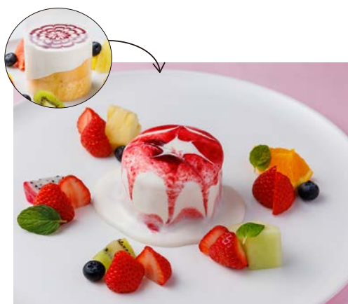
いちごのパンケーキ Strawberry Pancake

【いちごソース】 フィルムをはがすとたっぷりのクリームが とろ〜りとろけ出します たっぷりのいちごと共におたのしみください