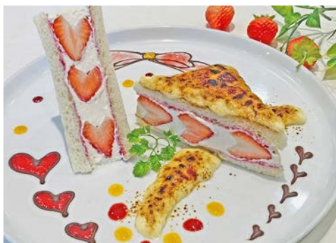
いちごサンドイッチ Strawberry Sandwich