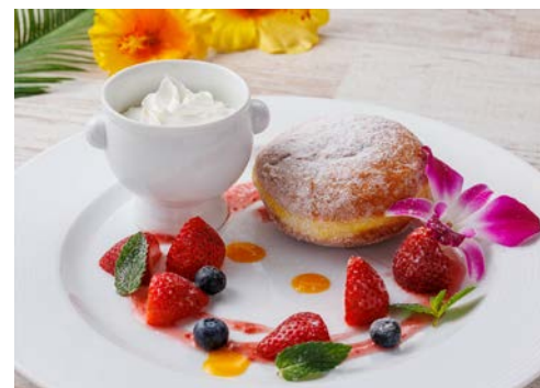
マラサダドーナツ Malasada Doughnut