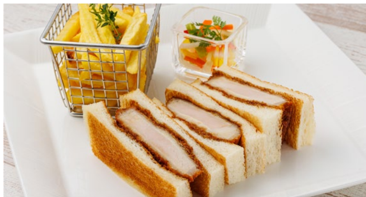
ポークカツサンド ¥1,500 Pork Cutlet Sandwich

※「プラントベースフード」をご提供しています。 (動物性原材料ではなく、植物由来の原材料を使用した食材)