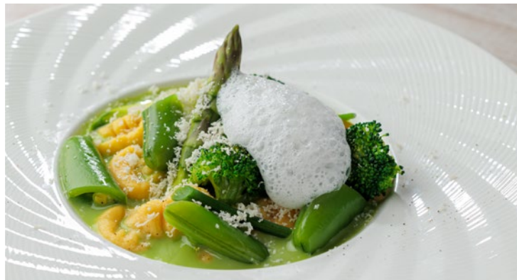
じゃがいものニョッキ 春野菜と共に ¥2,400 Potato gnocchi with spring vegetables

バターライスにサーロインステーキ 120g を添えて アクセントのトマトソースとアボカドと共に お召し上がりください