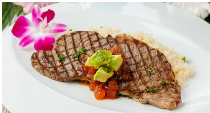
ハワイアンステーキライス ¥2,800 Hawaiian Steak Rice

バターライスにサーロインステーキ 120g を添えて アクセントのトマトソースとアボカドと共に お召し上がりください