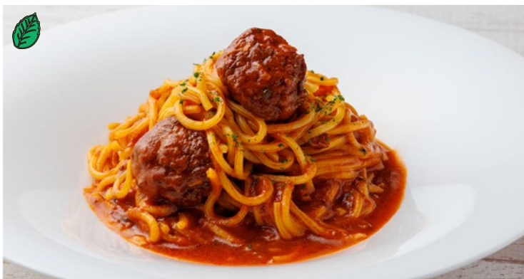
ベジボールのトマトソースパスタ ¥2,000 Vegetable Tomato Sauce Pasta

【春野菜】 インゲン豆・スナップエンドウ・絹さや・グリーンピース・アスパラガス・ブロッコリー