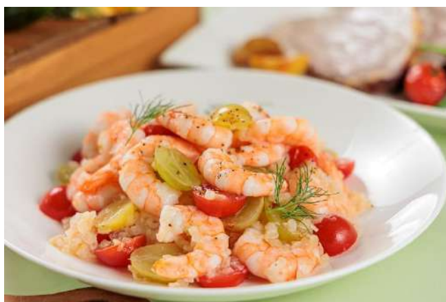
▲ 海老とシャインマスカットのソテー