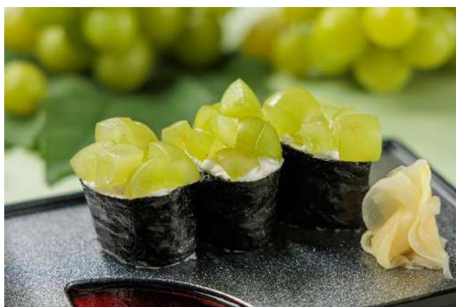
▲シャインマスカットの軍艦寿司