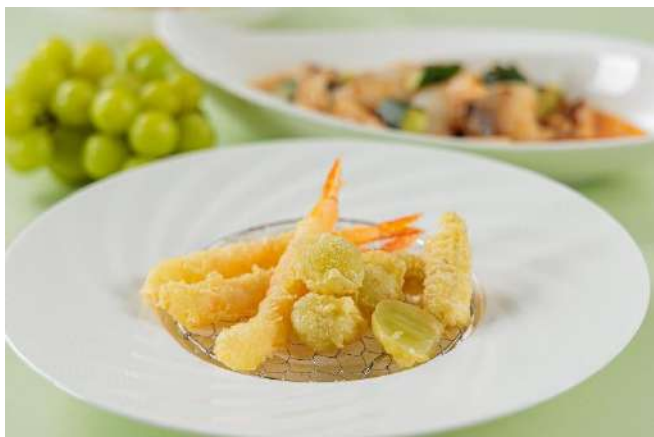
▲シャインマスカットの天ぷら