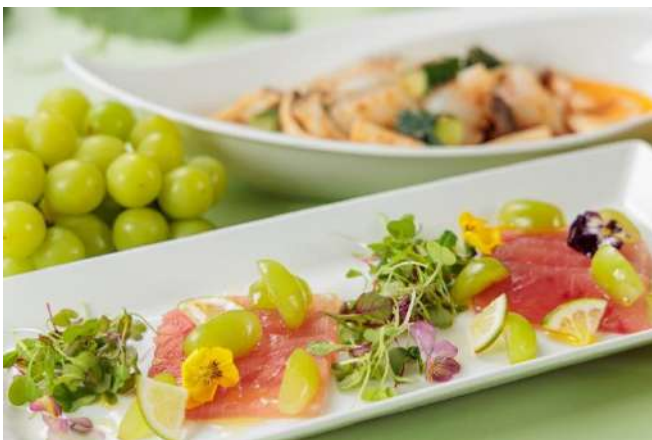
▲ 鮭のカルパッチョとシャインマスカットのマリネ