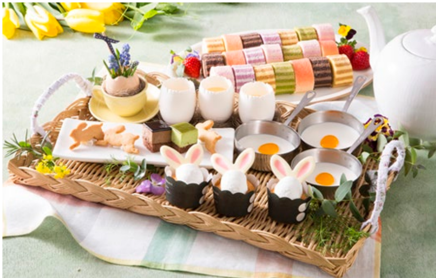
【グランディナー&ランチ】 カラフル&キュートなイースタースイーツたち