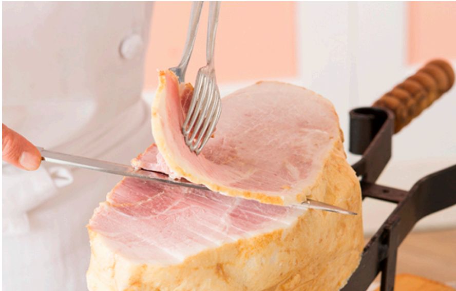
【グランディナー】 スイートベイクドハム。カッティングサービスをご用意します