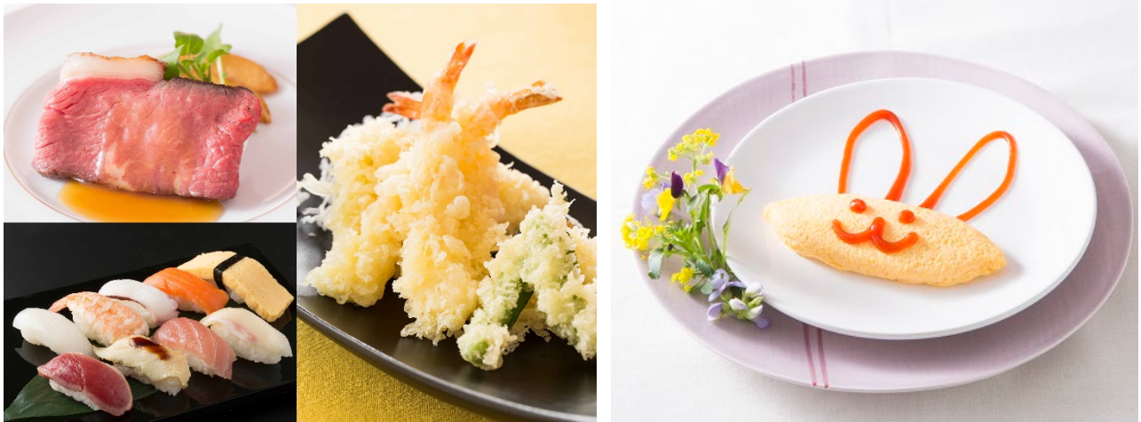
【グランbuffe】出来たてをぜひ! 人気のフードライブメニュー! 【グランbuffe&ランチ】イースター・バニーのオムレツ

<グラン> 和洋中、バラエティ豊かなお料理が楽しめる盛りだくさんのフル・buffe!“フードライブメニュー”では、イースター限定で「スイートベイクドハム」とキュートなうさぎの「イースター・バニーのオムレツ」をご用意。他、ジューシーな「国産牛のローストビーフ」、サクサクの「天ぷら」、「にぎり寿司」などをシェフが目の前でサービスします。「にんじんのパウンドケーキ」やたまご型の「プリン」、うさ耳の「カップケーキ」などスイーツも充実。スプリング・カラーをまとったカラフルな「ミニロールケーキ」や 2色のチョコレートファウンテンはとってもフォトジェニック! オリジナルパフェも作れるので、デザートタイムまでたっぷりとお楽しみいただけるはず。