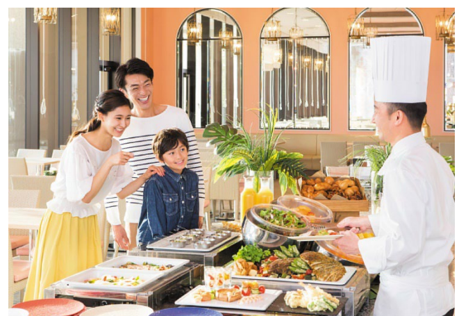
【ランチbuffet】 イースター気分をお手軽に満喫♪