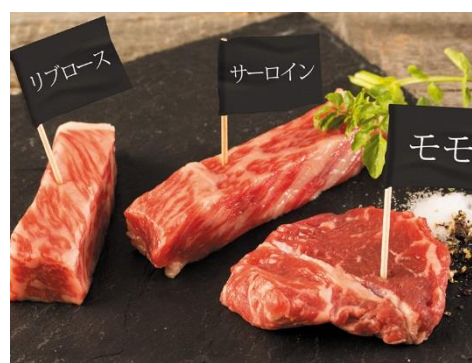
ディナー限定で登場する「アニバーサリースペシャルオプション」※有料