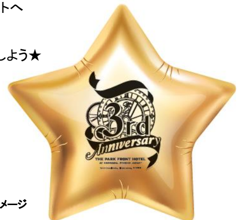
バルーンイメージ