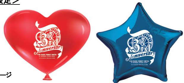
バルーンイメージ